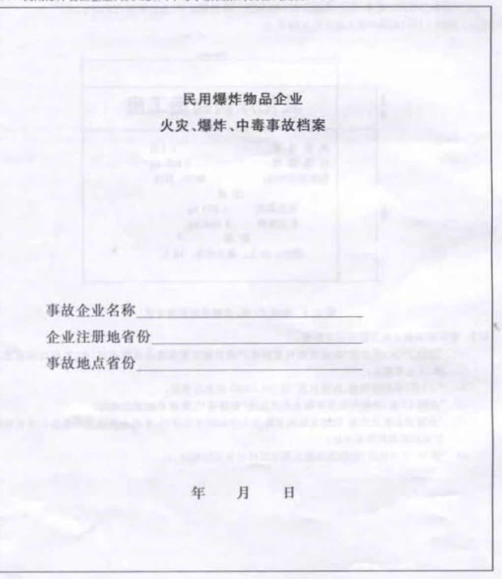
图 E.1 民用爆炸物品企业火灾、爆炸、中毒事故档案封面格式